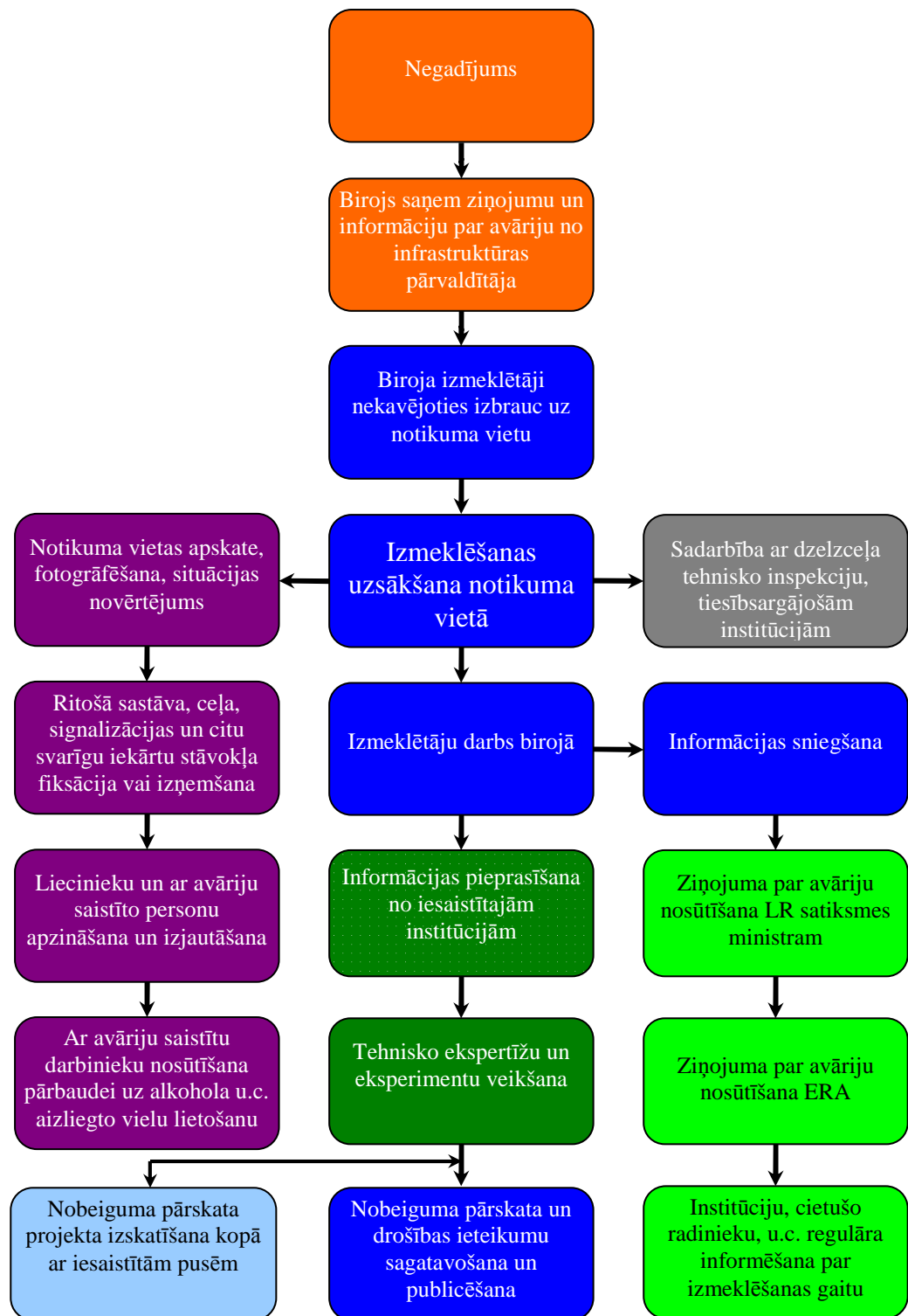
3. att. Izmeklēšanas process